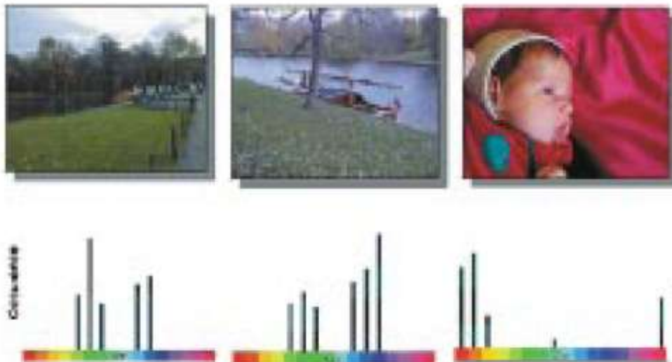
Fig. 2. Three color images and their MPEG-7 histogram color distribution, depicted using a simplified color histogram. Based on the color distribution, the two left images would be recognized as more similar compared to the one on the right.