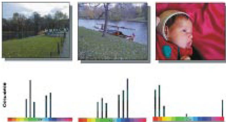
Fig. 2. Three color images and their MPEG-7 histogram color distribution, depicted using a simplified color histogram. Based on the color distribution, the two left images would be recognized as more similar compared to the one on the right.