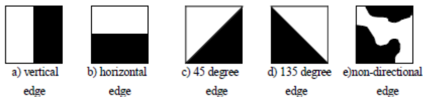
Figura 2 – Cinco tipos de fronteiras

Nota: Para mais detalhes consulte o ficheiro anexo: “VC_1415_P8_LEH.pdf”