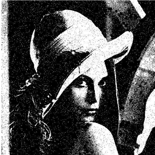
a) Imagem AP7_2